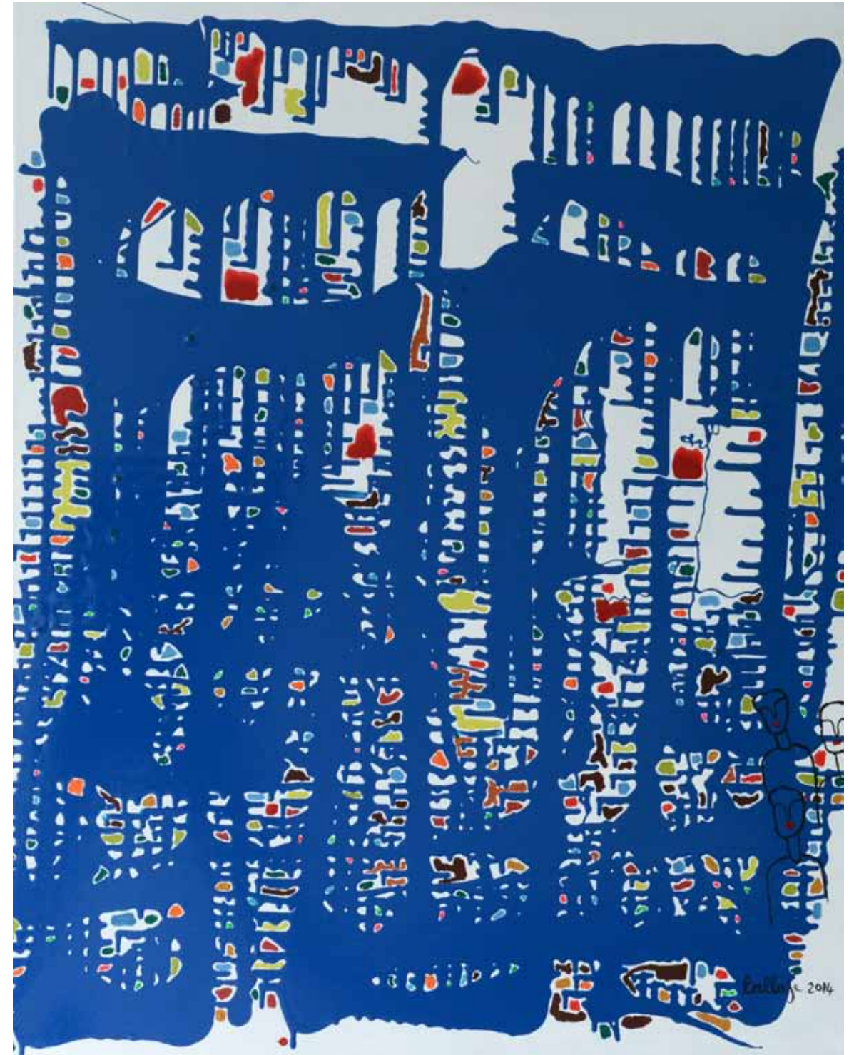
Mon rêve Acrylique sur toile, 2014, 100 x 91 cm