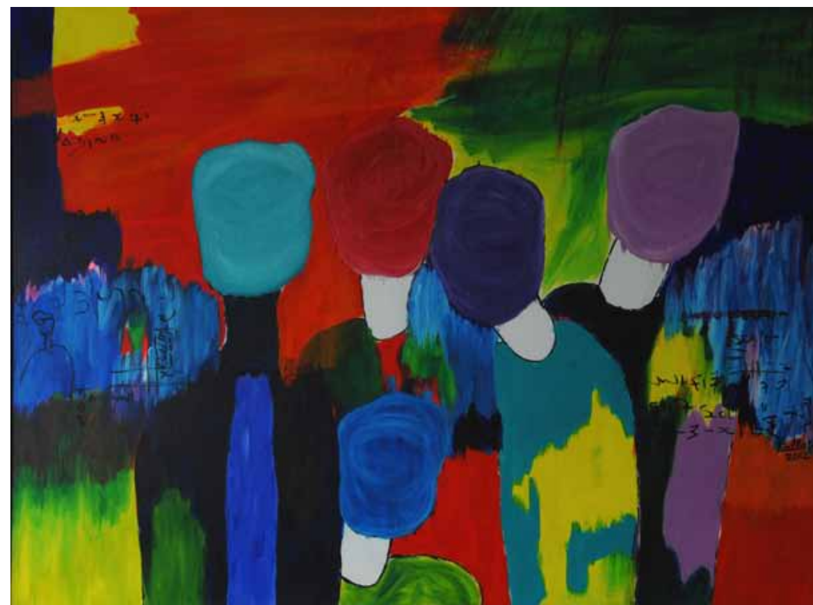
Les Anges Acrylique sur toile, 2012, 150 x 120 cm