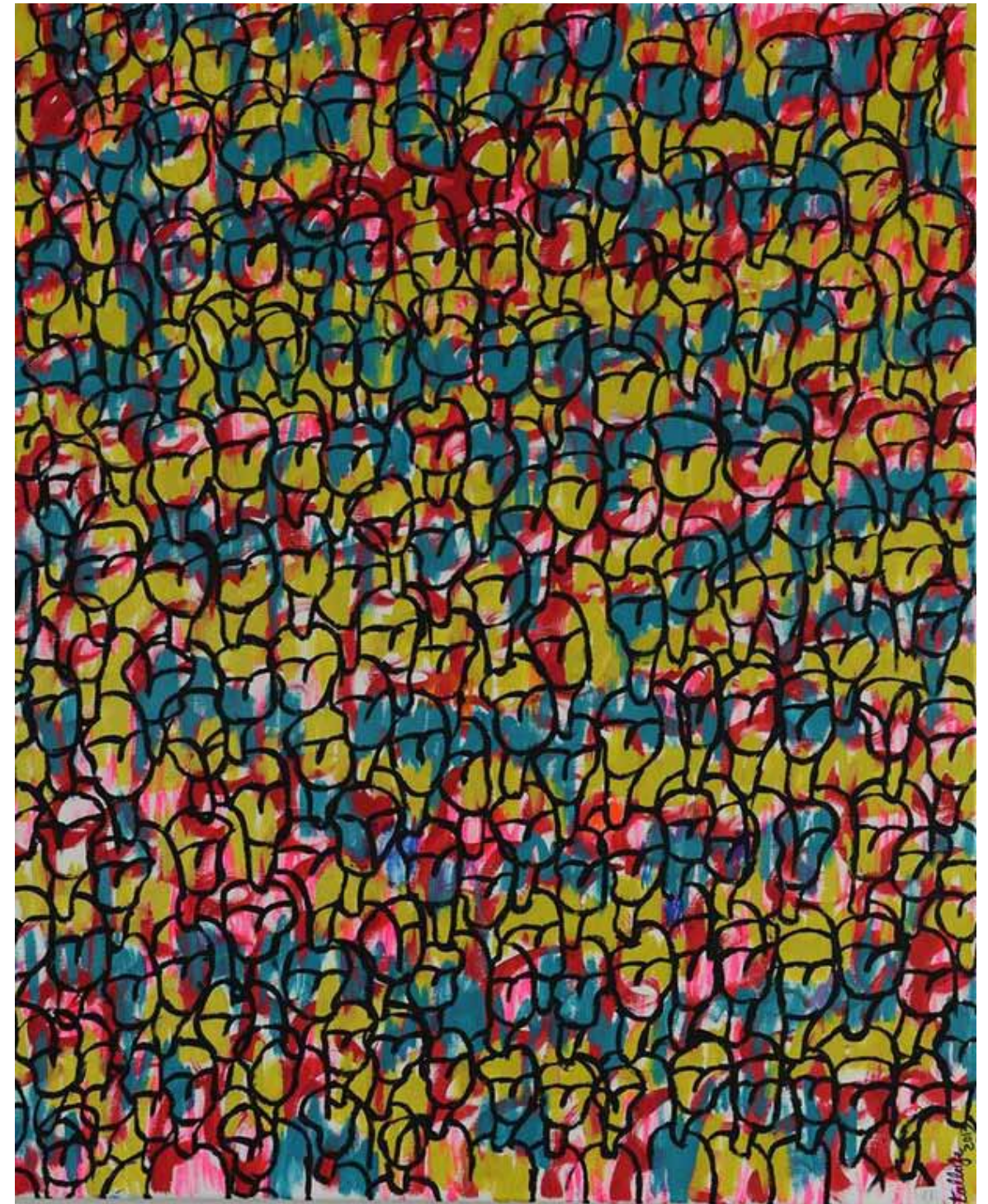
Femme morte parmi les vivants Acrylique sur toile, 2015, 100 x 81 cm