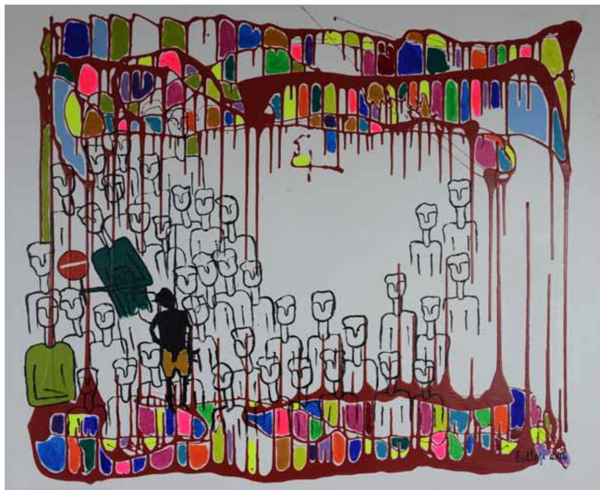
Une grande part pour l'homme Acrylique sur toile, 2014, 100 x 91 cm