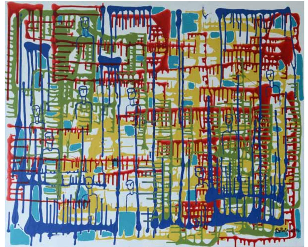
Une reine sans couronne