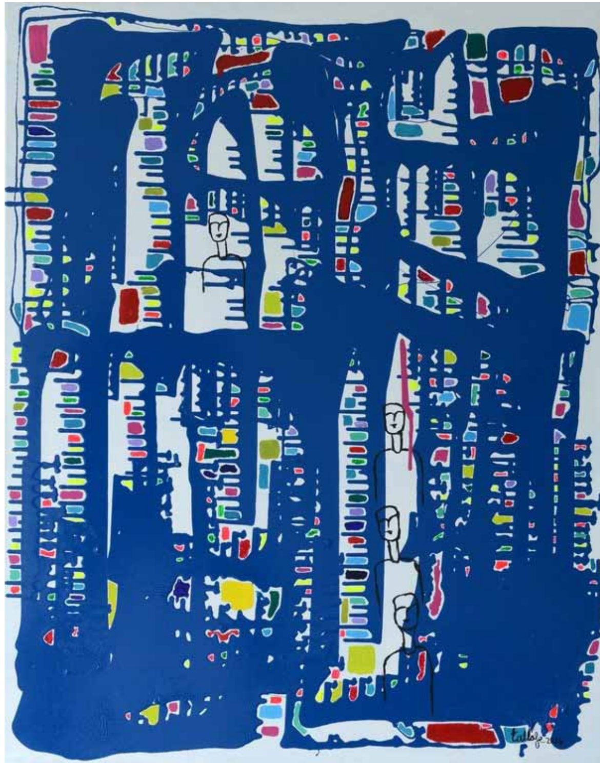
Mon rêve 2 Acrylique sur toile, 2015, 100 x 81 cm