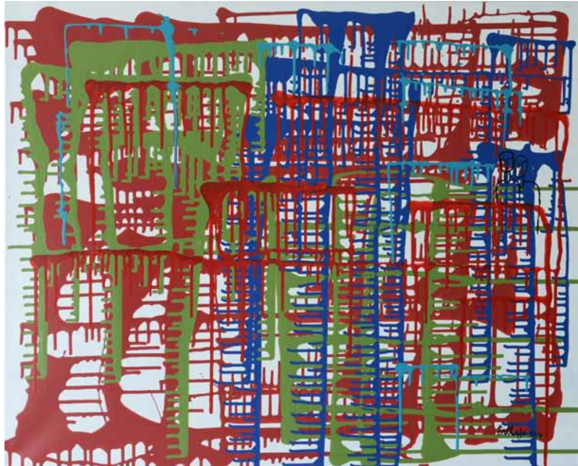
Nous Acrylique sur toile, 2014, 100 x 91 cm