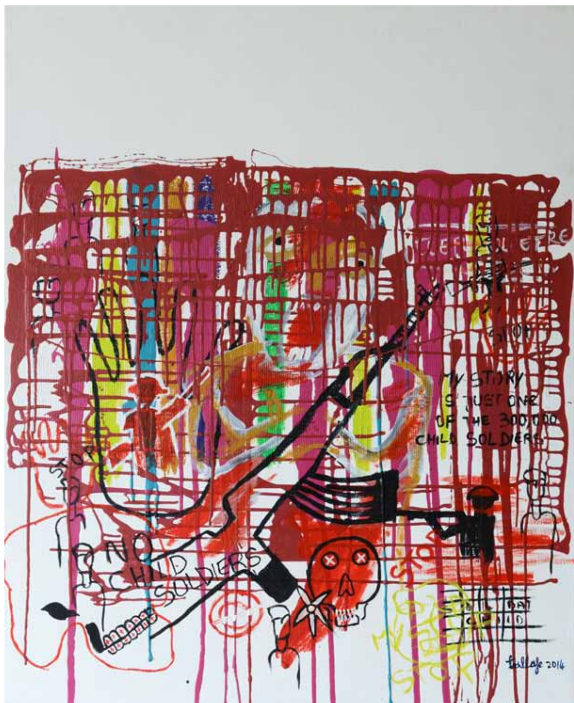
Karim enfants soldats Acrylique sur toile, 2014, 100 x 91 cm