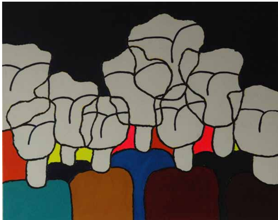
Le regard Acrylique sur toile, 2012, 81 x 65 cm