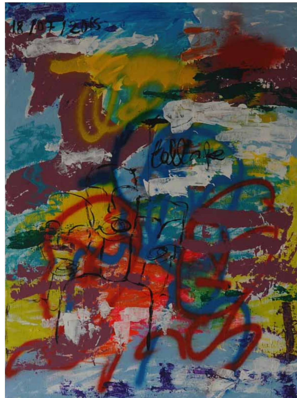
Saint Ouen Acrylique sur toile , 2015, 81 x 65 cm