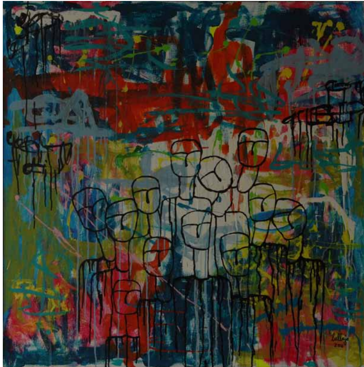
Qui nous sommes Acrylique sur toile, 2016, 100 x 100 cm