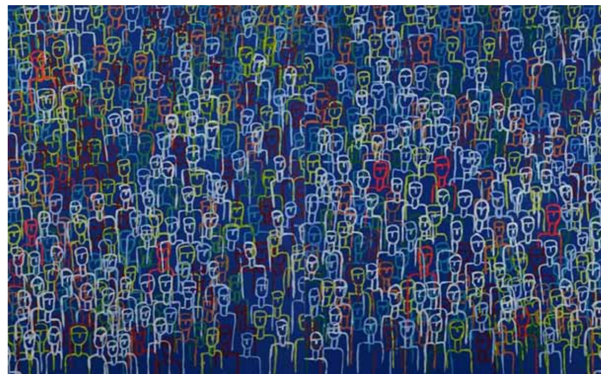
La manif Acrylique sur toile, 2014, 81 x 65 cm